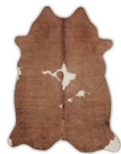
Imitace kůže, 1 699 Kč