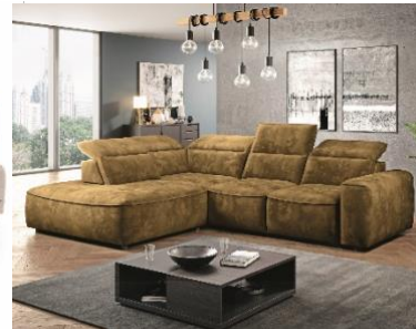
Sedací souprava Colombo, 49 999 Kč