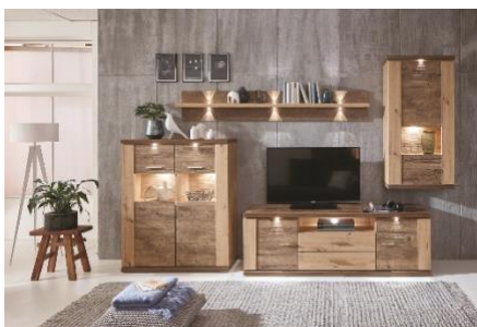
Obývací stěna Grande, 26 999 Kč

Dřevěný dekor se stále těší obrovské popularitě. A není divu – poslední trendy směřují k návratu k přírodě a materiálům, které nám dává. Proto se výborně hodí právě do boho interiérů. Ležerní look tohoto stylu bydlení podtrhne například dekor s vintage optikou či s výraznou přírodní kresbou. Můžete sáhnout třeba po variabilních systémech. Nabízí totiž velké množství různých kusů nábytku, které můžete využít v celé domácnosti, a to od předsíně až po obývací pokoje, dětské pokojíčky či ložnice. Jejich nespornou výhodou je stejný design, díky němuž bude místnost působit harmonicky.