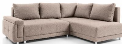
Sedací souprava Beate, 15 999 Kč