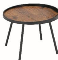
Konferenční stůl Rimbo, 1 799 Kč