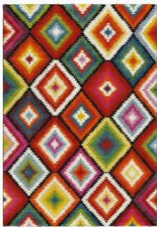
Koberec Relief, 2 199 Kč

Boho styl doslova vyžaduje pestrou barevnou škálu. Většinou využívá spíše teplé odstíny žluté, červené, hnědé, ale nebojí se ani chladnějších tónů, jako je modrá a zelená. Důvodem, proč tento styl působí tak domácky, je také kombinace různých textur a materiálů. Hodně se používá proutí, dřevo či bavlna, ale rozhodně nejsou zapovězeny ani další materiály. Cílem je, aby byl pokoj útulný nikoliv přeplácáný. Toho lze docílit kombinací výrazných prvků s neutrálními tóny béžové či bílé. Zajímavě budou vypadat také exotické a orientální dekorace, které dodají vašemu obývacímu pokoji šmrnc.