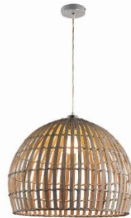
Lustr Canvas, 799 Kč