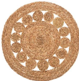
Koberec Nature, 749 Kč