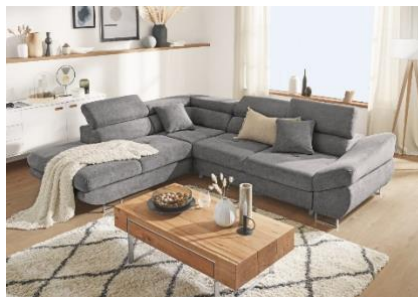
Sedací souprava Fabio, 27 999 Kč

Pro obývací pokoj je místo k sezení velmi důležité. Při výběru sedací soupravy je dobré zohlednit celou řadu aspektů. Jedním z nejdůležitějších jsou prostorové možnosti místnosti, podle kterých můžeme volit velikost i kompozici soupravy. Do bohémsky laděných obývacích je lepší volit spíše neutrální teplé odstíny béžové, žluté či hnědé, které budou ladit s výraznými doplňky či výmalbou. Zapovězeny ale nejsou ani výrazné odstíny. U těch je ale třeba počítat s tím, že budou výraznou dominantou místnosti, a volit tak střídmější doplňky.